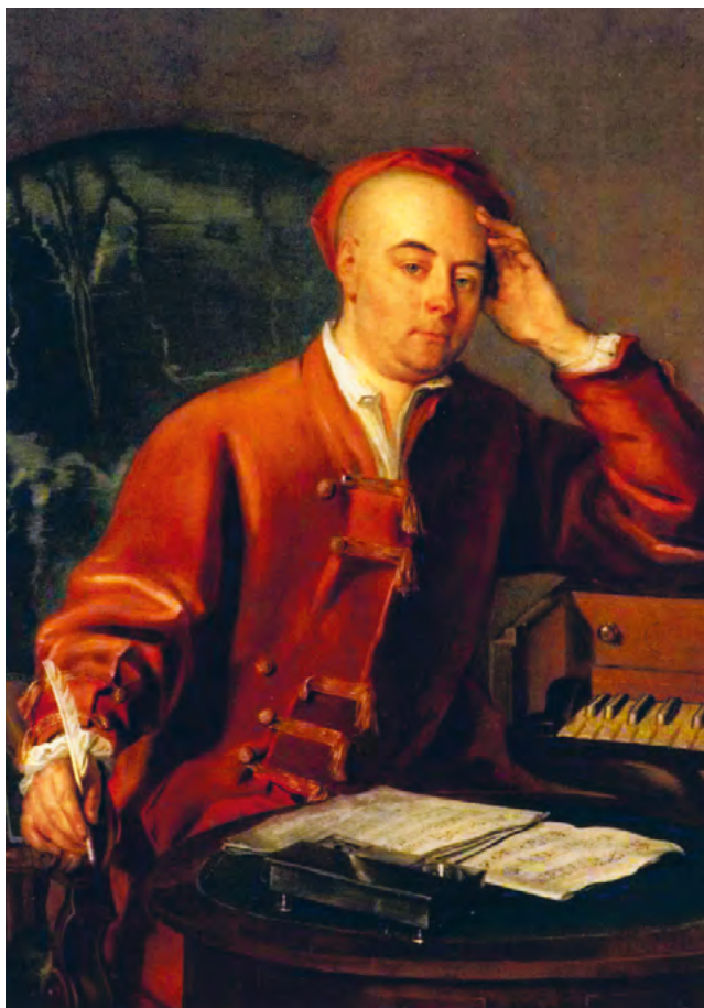
Georg Friedrich Händel ca. 1730, Gemälde von Philip Mercier

und er hat sich mit seiner ganzen Energie und Kreativität engagiert. Das Ergebnis ist wirklich sehr gelungen und ich bin ihm sehr dankbar.